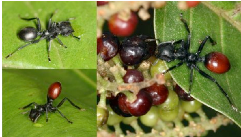
Beere mit Beinen?

© Steve Yanoviak, Universität von Alaska Ameise mit Parasitenbefall