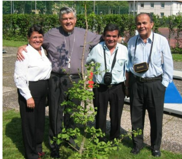
Bischof Piñeiro mit Mitgliedern des Consejo Nacional vor dem Partnerschaftsbaum in Rastatt, 6. Mai 2006

Mons. Salvador Piñeiro, Militärbischof von Peru